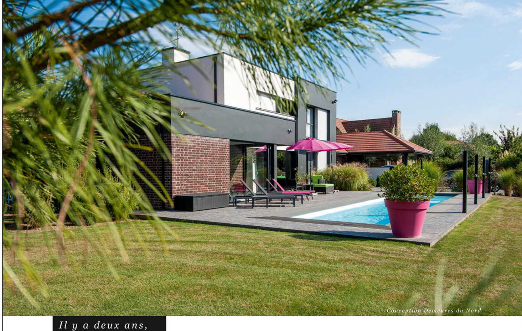
Conception Demeures du Nord

TEXTE : SOPHIE HELOUARD